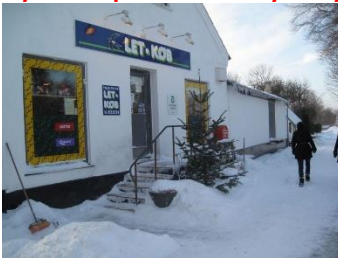
Foto fra dengang det var vinter

Vores butik Letkøb har pyntet rigtig fint op til jul, og som noget nyt har bestyrelsen sat et cafébord og stole op i butikken. Her kan man købe en kop kaffe eller te til 5 kr. i december, så man kan slappe af, sænke jule-stress-skuldrene, nyde julestemningen og måske få en sludder med andre ligesindede.